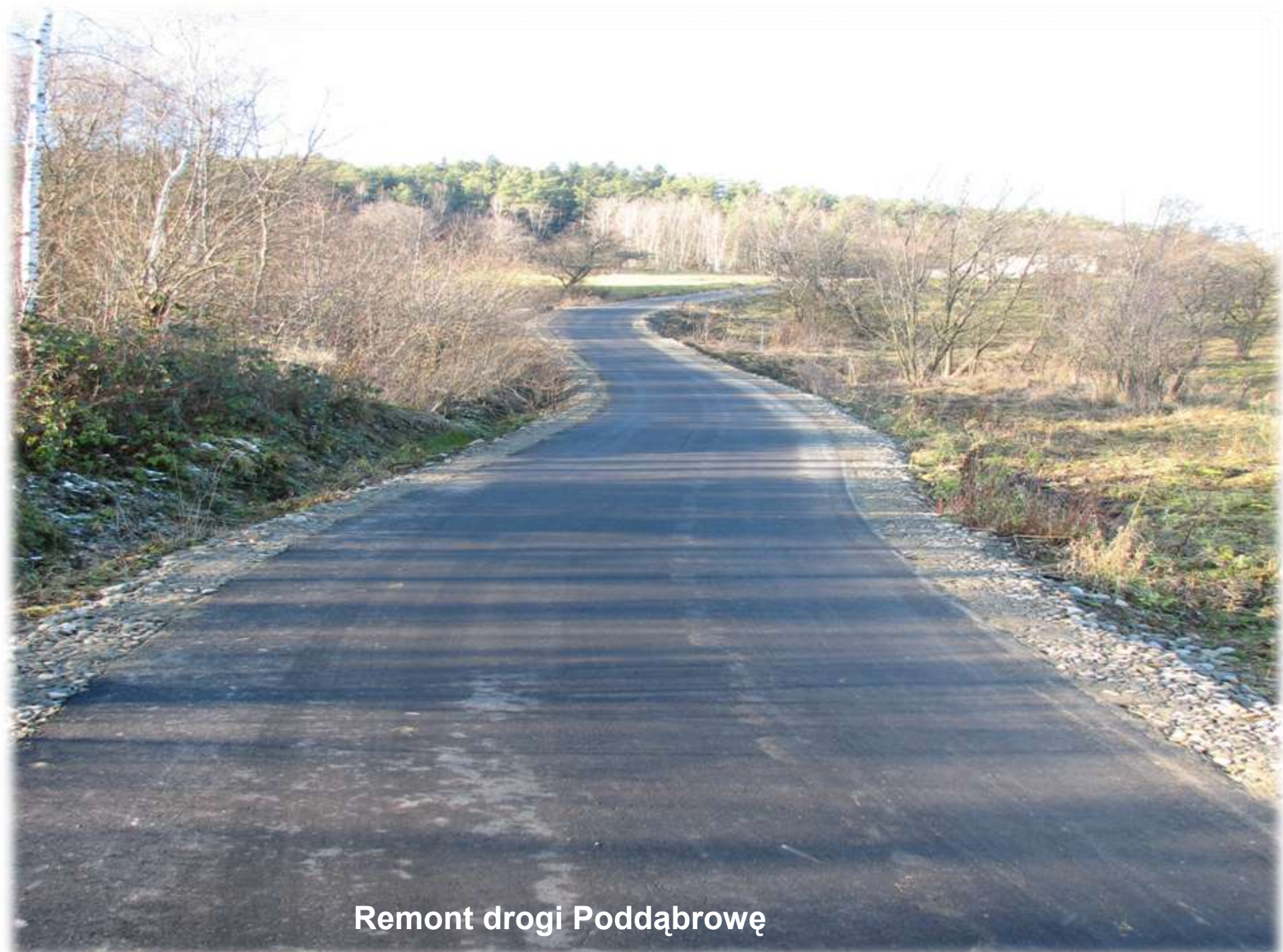
Remont drogi Poddąbrowę