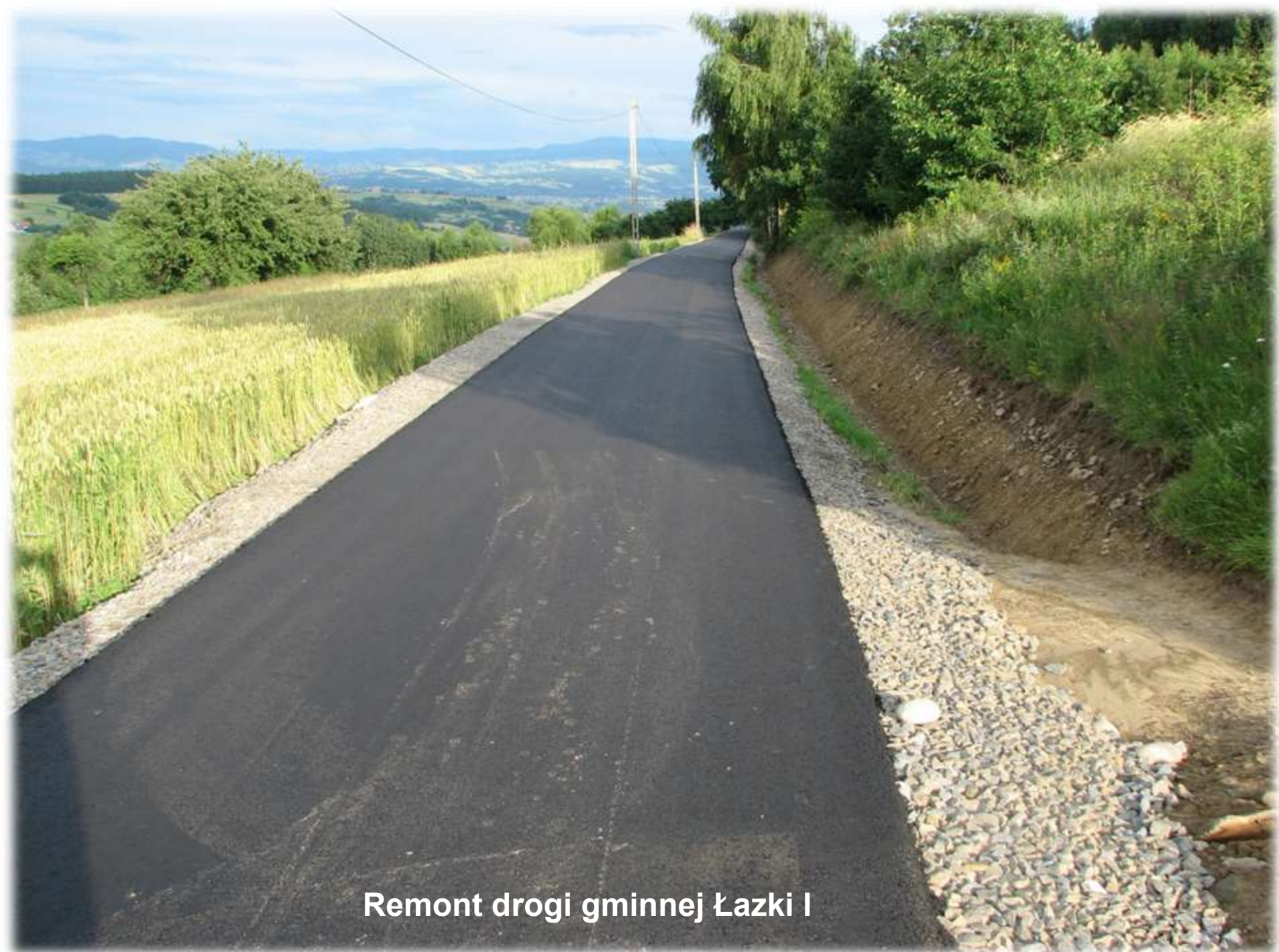
Remont drogi gminnej Łazki I