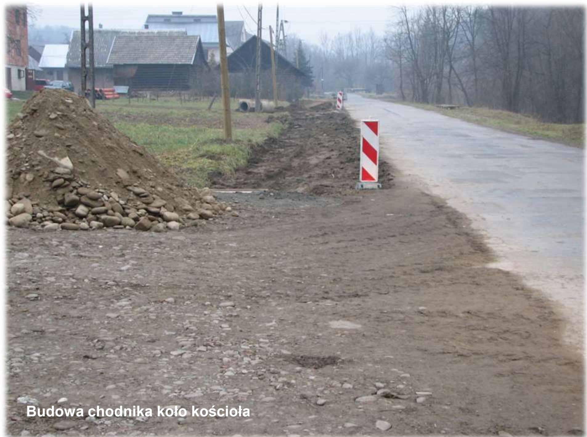
Budowa chodnika koło kościoła