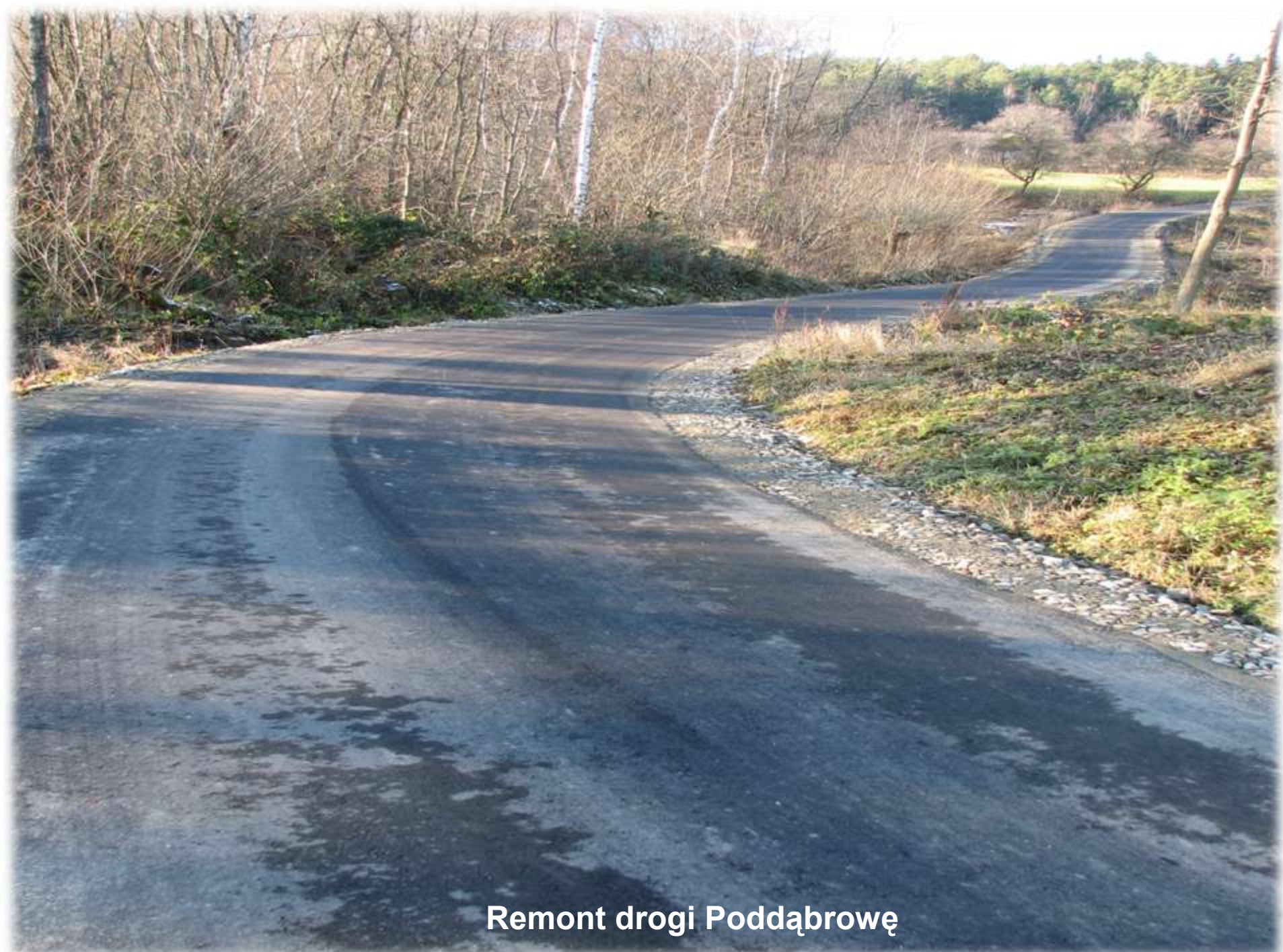
Remont drogi Poddąbrowę