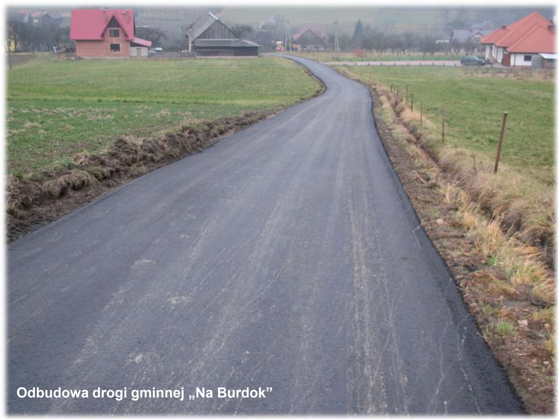
Odbudowa drogi gminnej „Na Burdok”