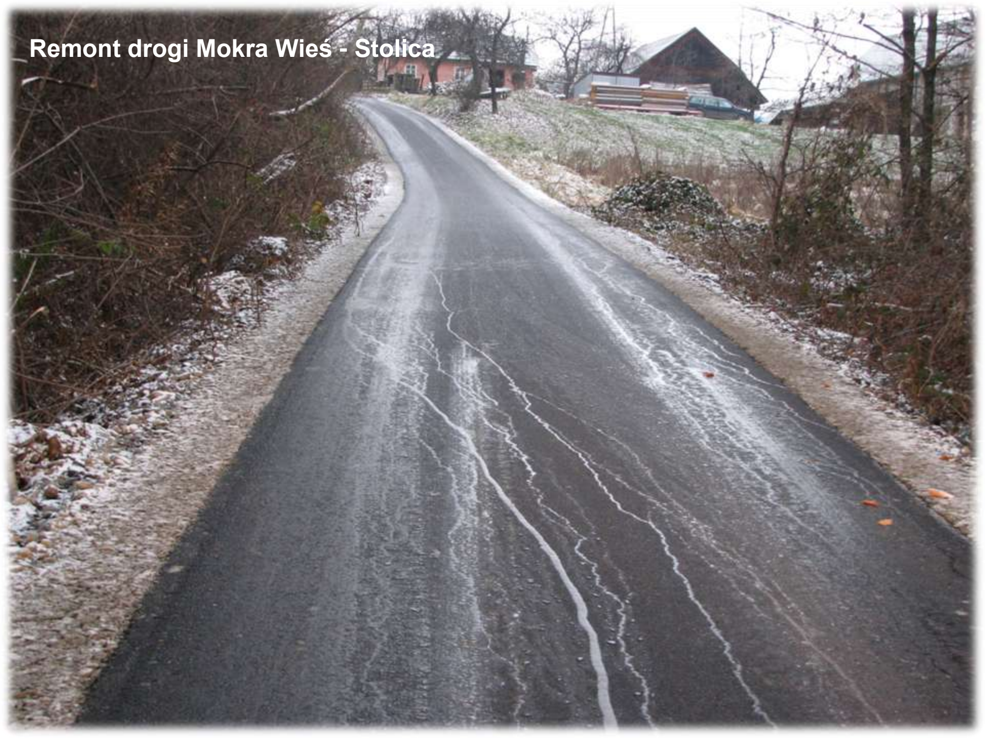
Remont drogi Mokra Wieś - Stolica