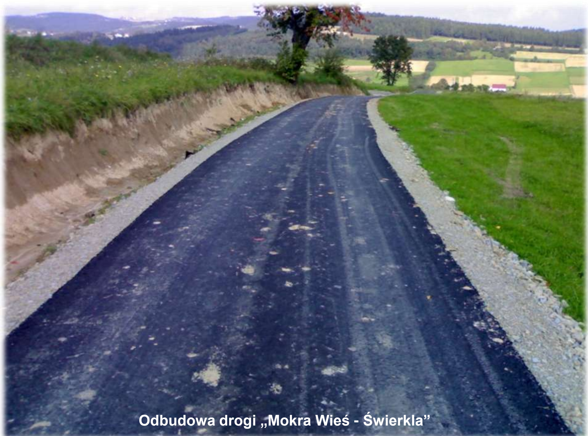
Odbudowa drogi „Mokra Wieś - Świerkla”