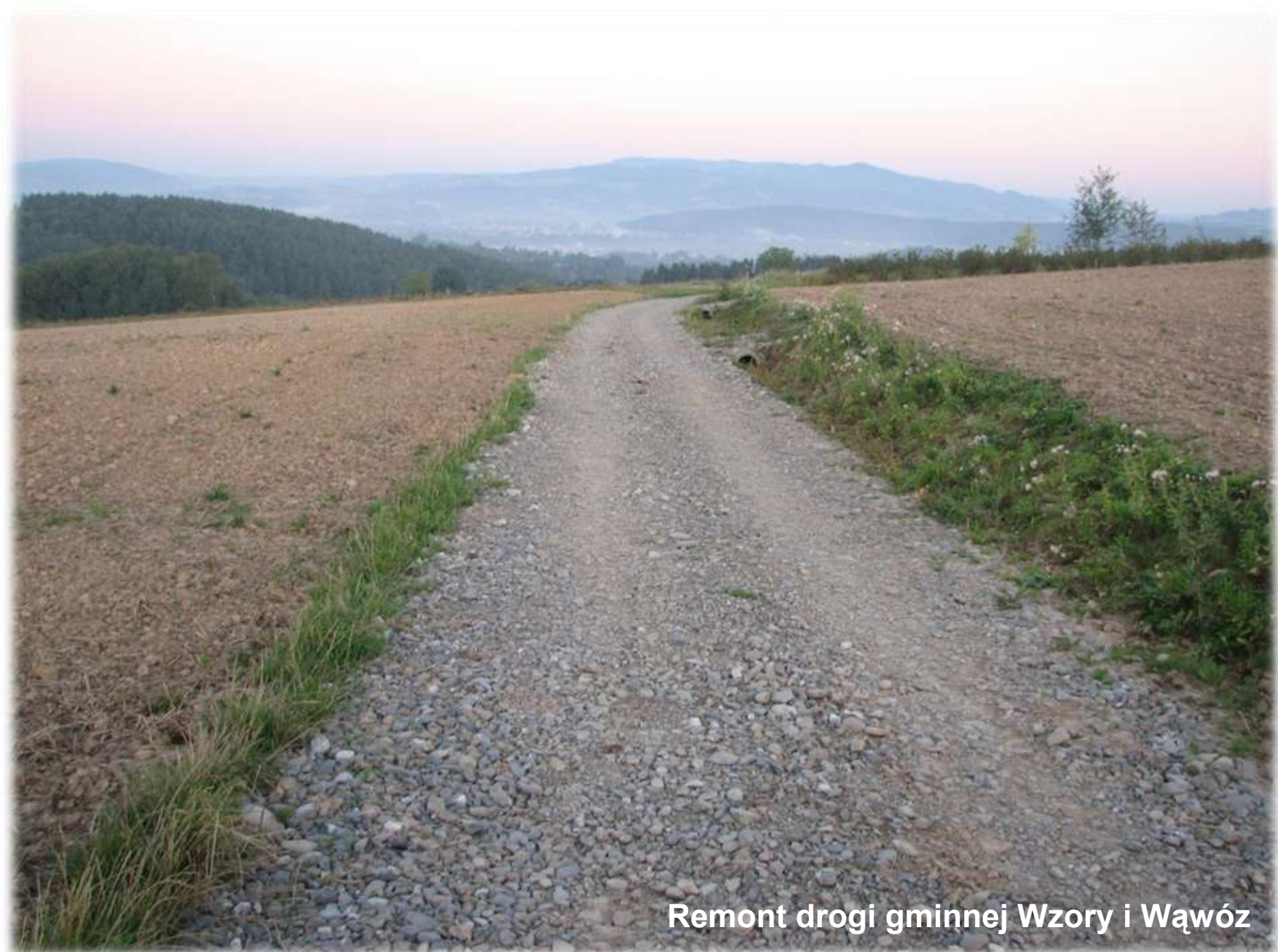
Remont drogi gminnej Wzory i Wąwóz