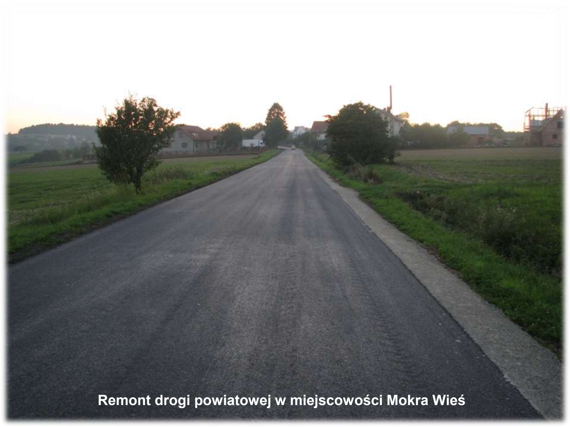
Remont drogi powiatowej w miejscowości Mokra Wieś