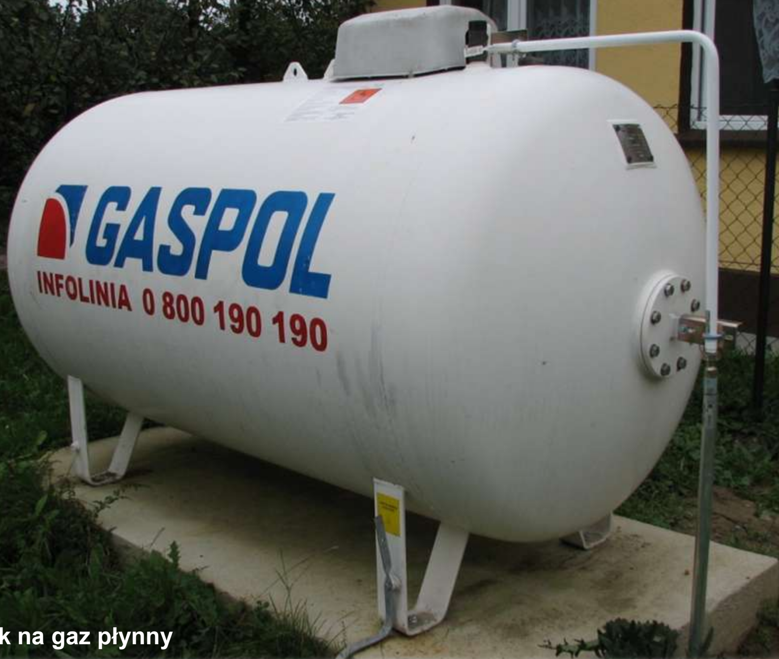
Zbiornik na gaz płynny