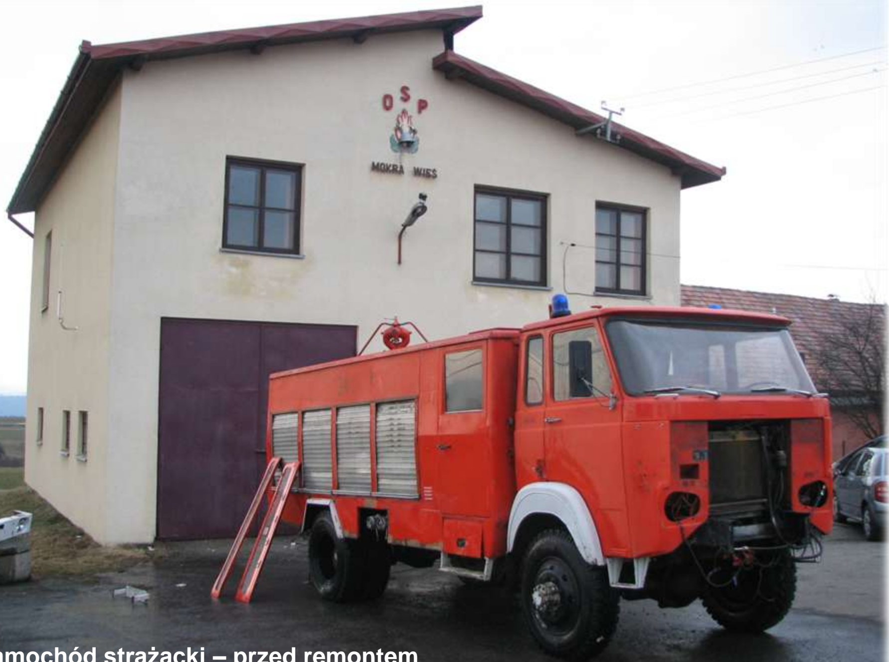
Samochód strażacki – przed remontem