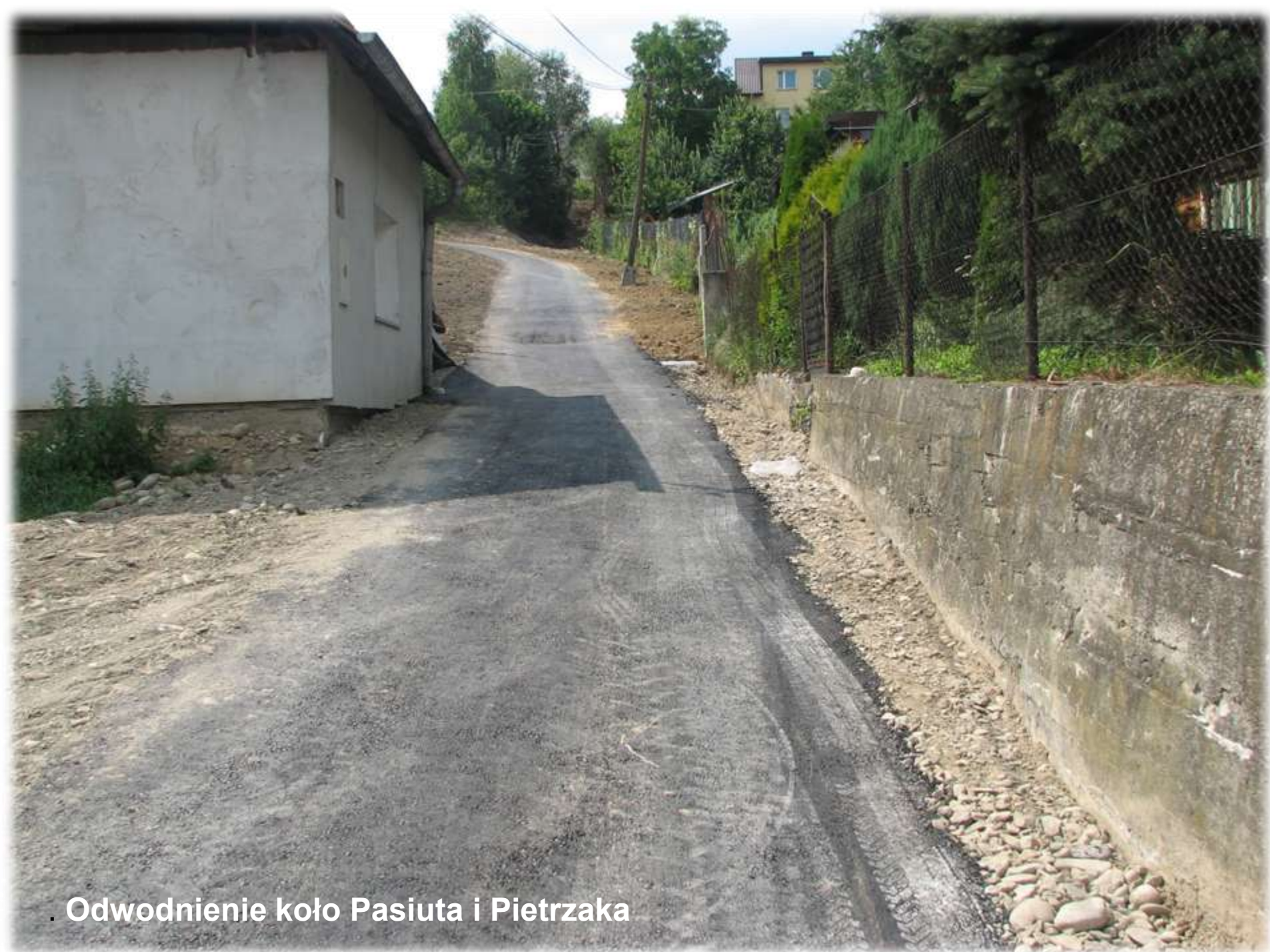
Odwodnienie koło Pasiuta i Pietrzaka