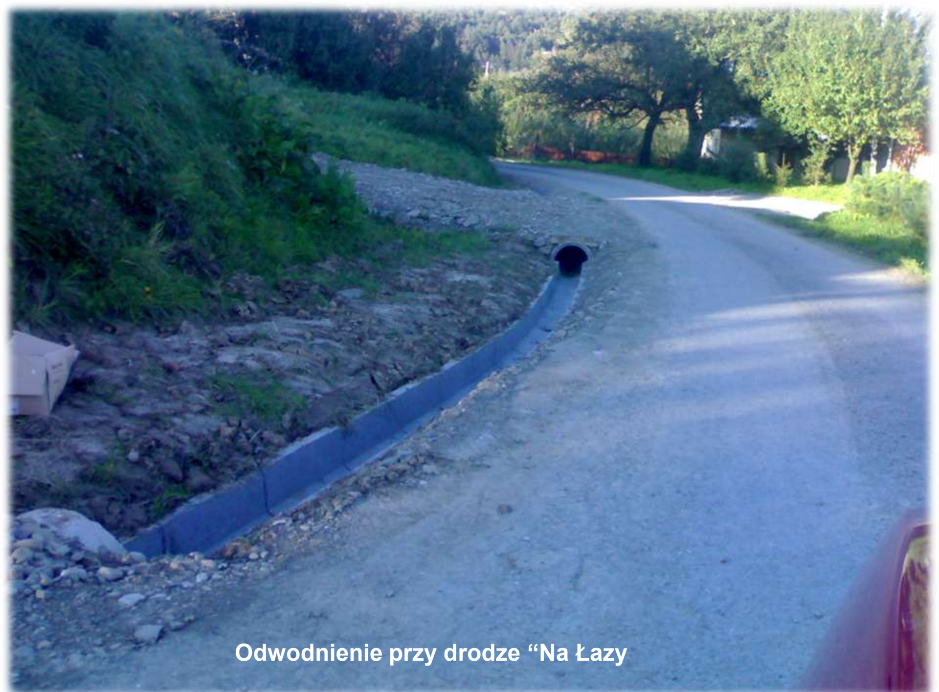
Odwodnienie przy drodze "Na Łazy