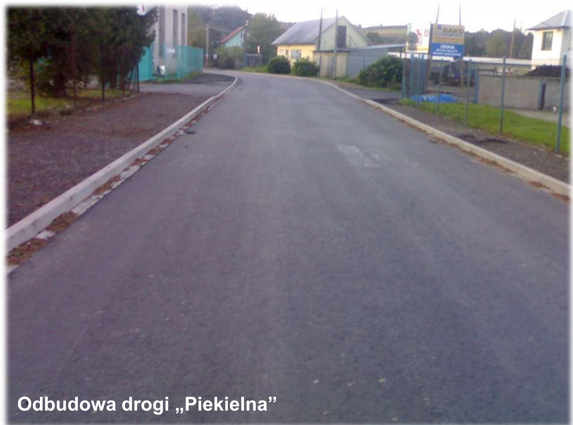
Odbudowa drogi „Piekielna”