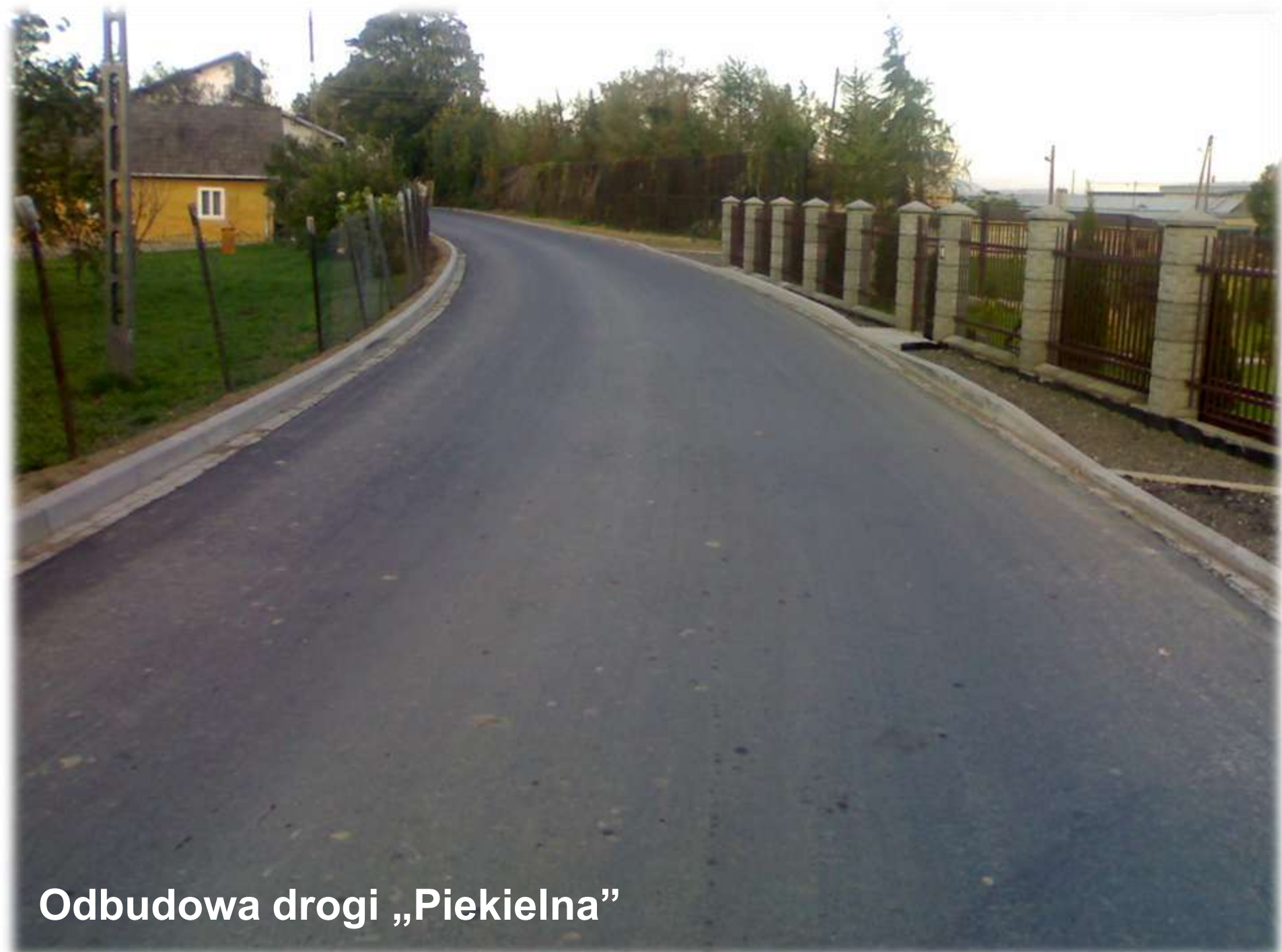
Odbudowa drogi „Piekielna”