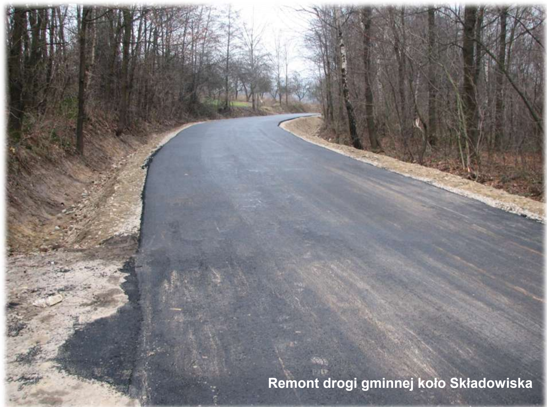
Remont drogi gminnej koło Składowiska