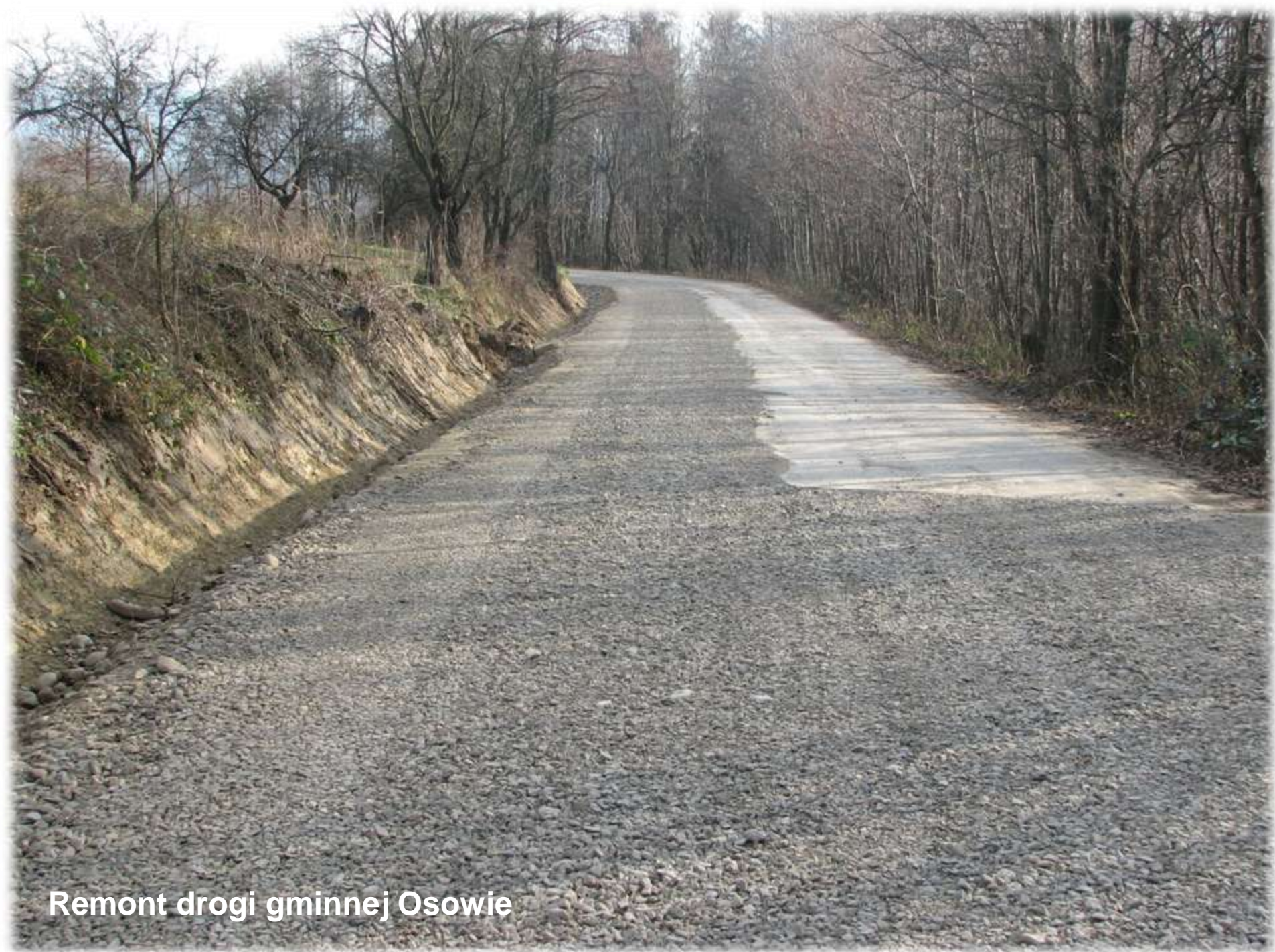
Remont drogi gminnej Osowie