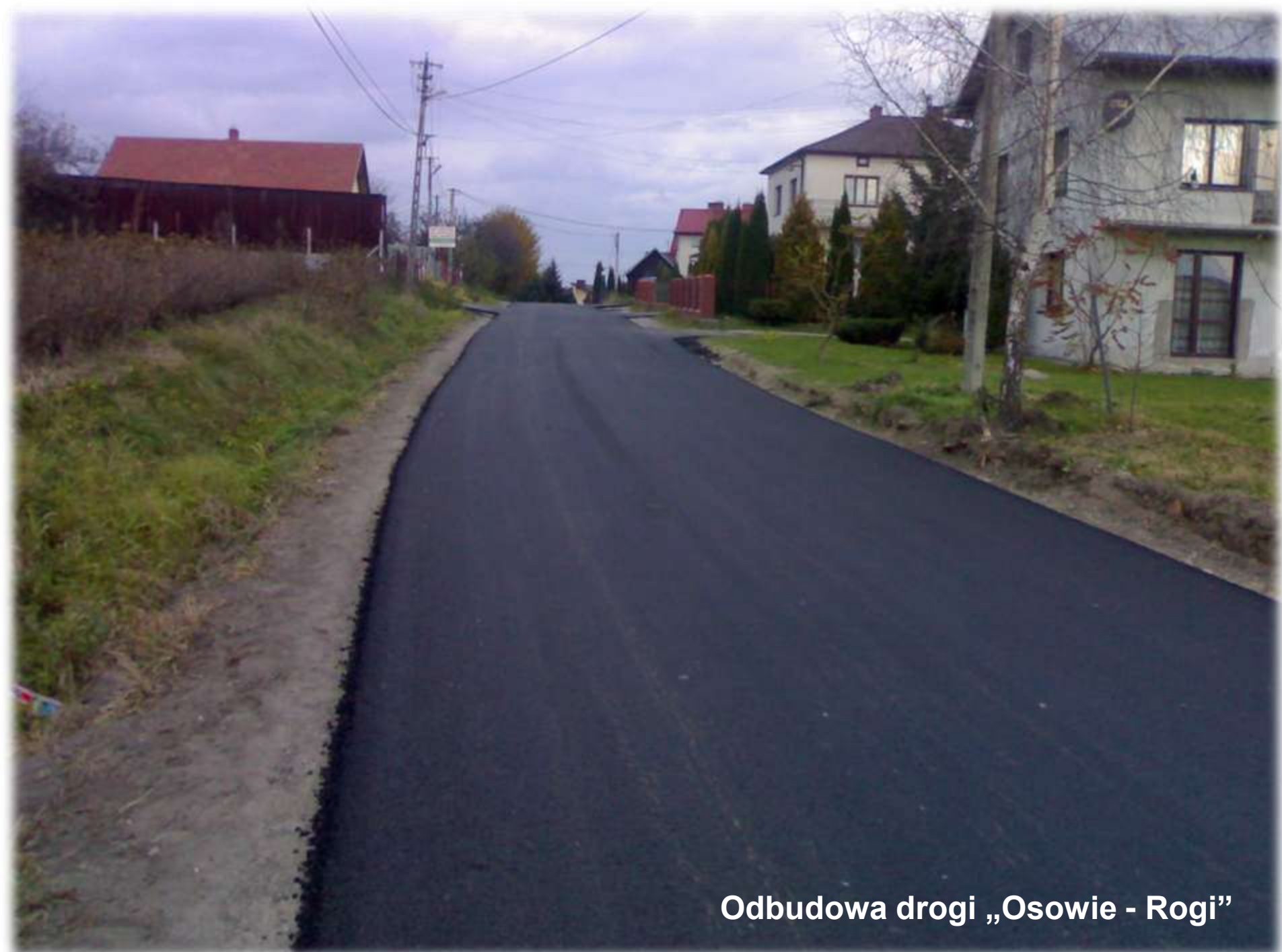
Odbudowa drogi „Osowie - Rogi”