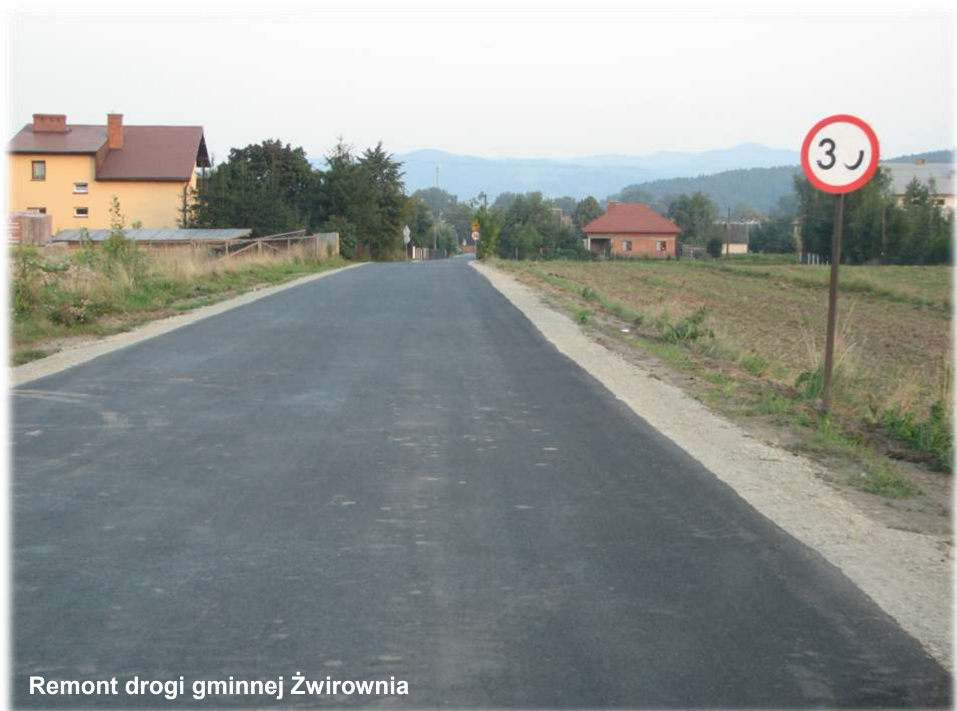
Remont drogi gminnej Żwirownia