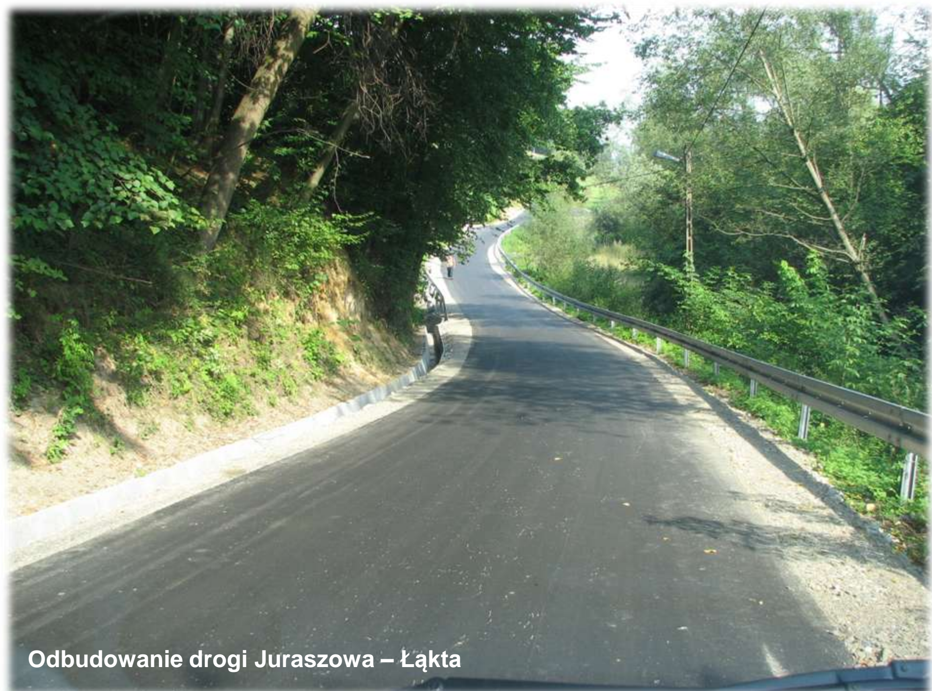
Odbudowanie drogi Juraszowa – Łakta