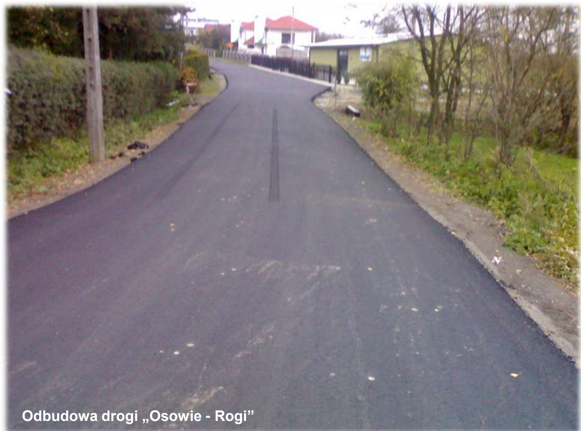
Odbudowa drogi „Osowie - Rogi”