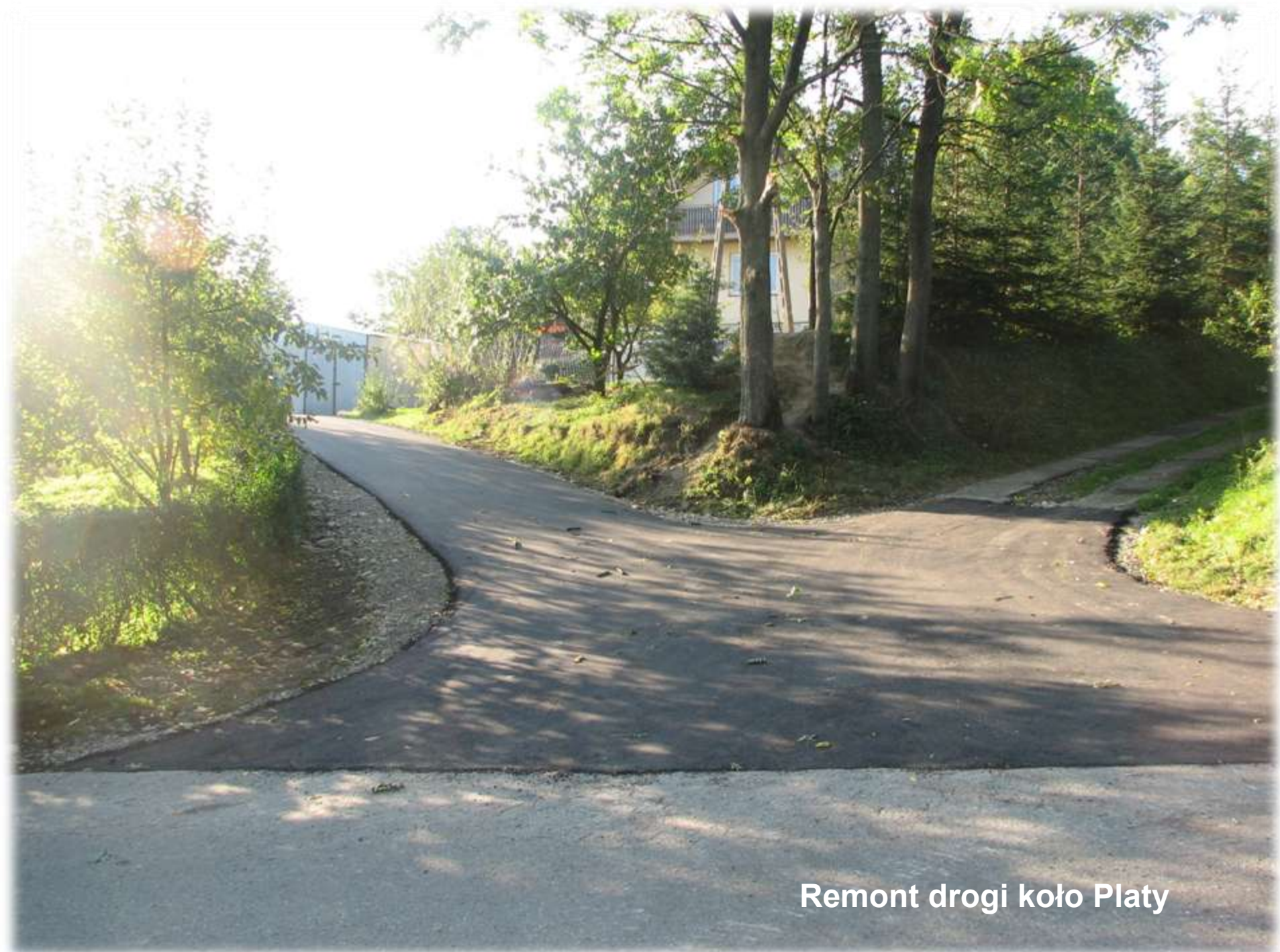
Remont drogi koło Platy