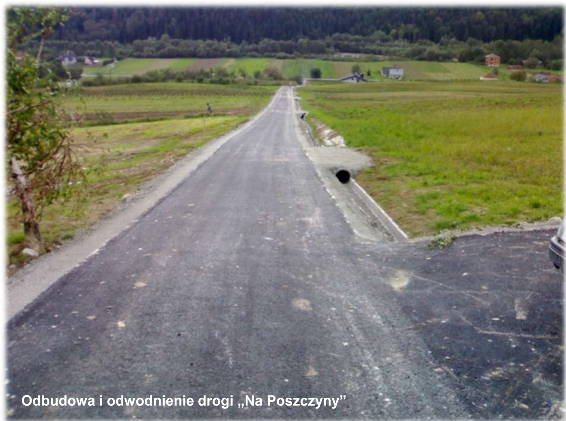
Odbudowa i odwodnienie drogi „Na Poszczynty”