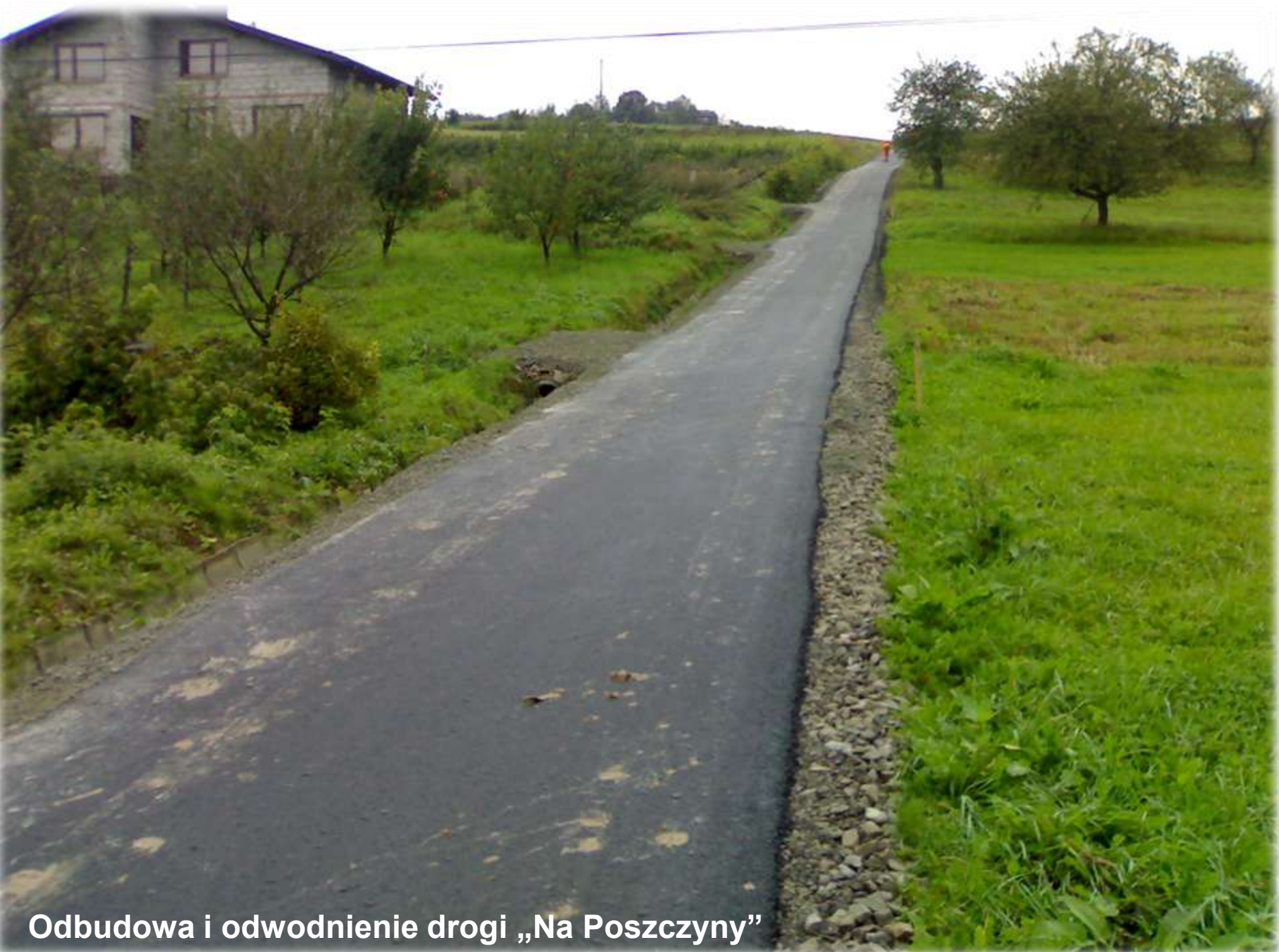
Odbudowa i odwodnienie drogi „Na Poszczynty”