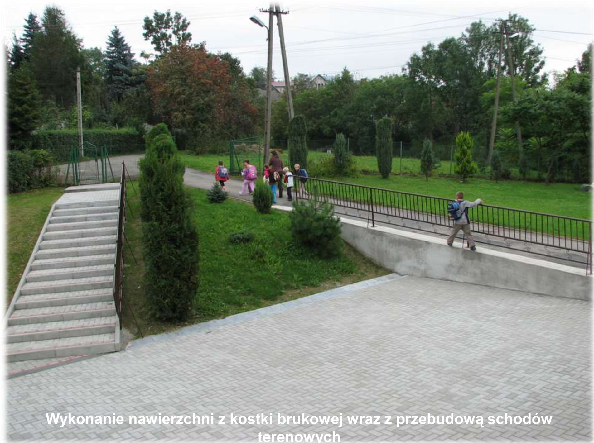
Wykonanie nawierzchni z kostki brukowej wraz z przebudową schodów terenowych