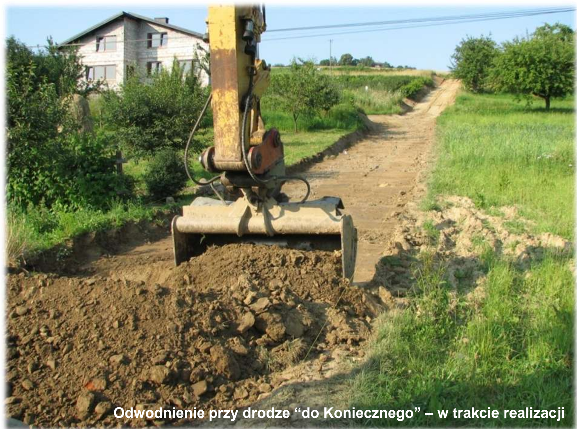
Odwodnienie przy drodze "do Koniecznego" – w trakcie realizacji