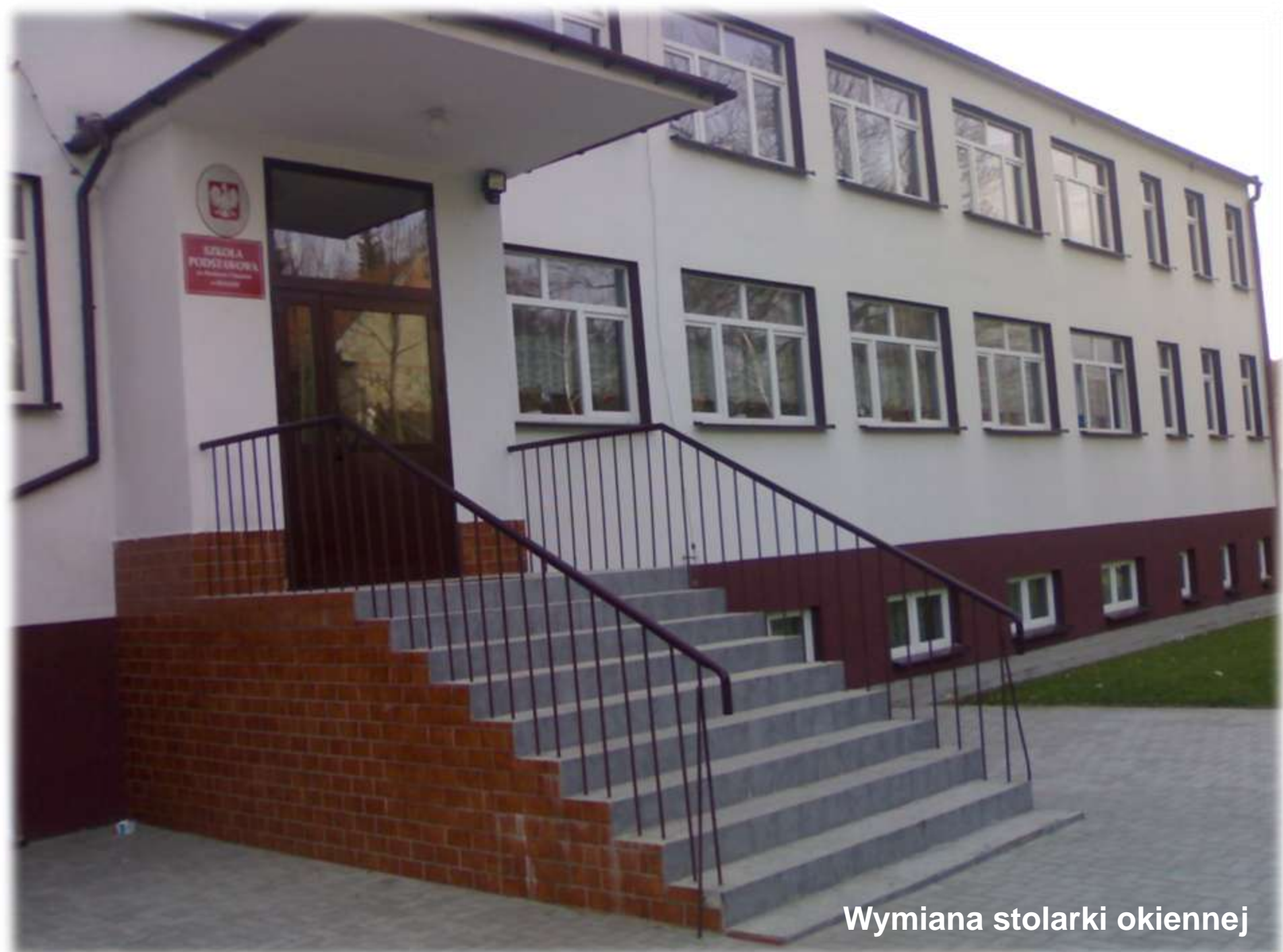
Wymiana stolarki okiennej