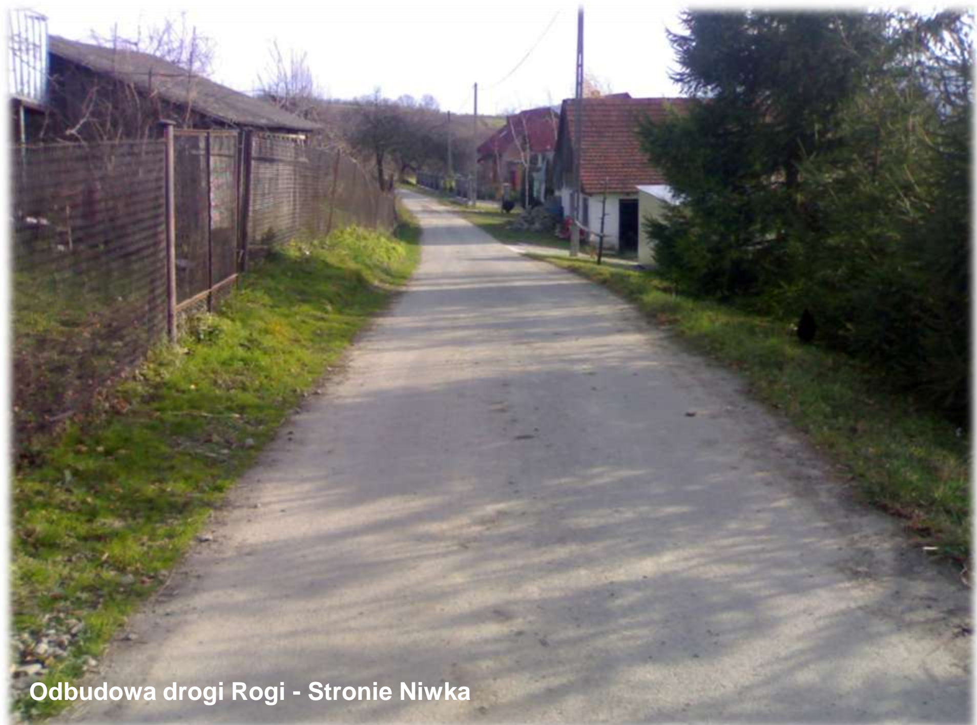
Odbudowa drogi Rogi - Stronie Niwka