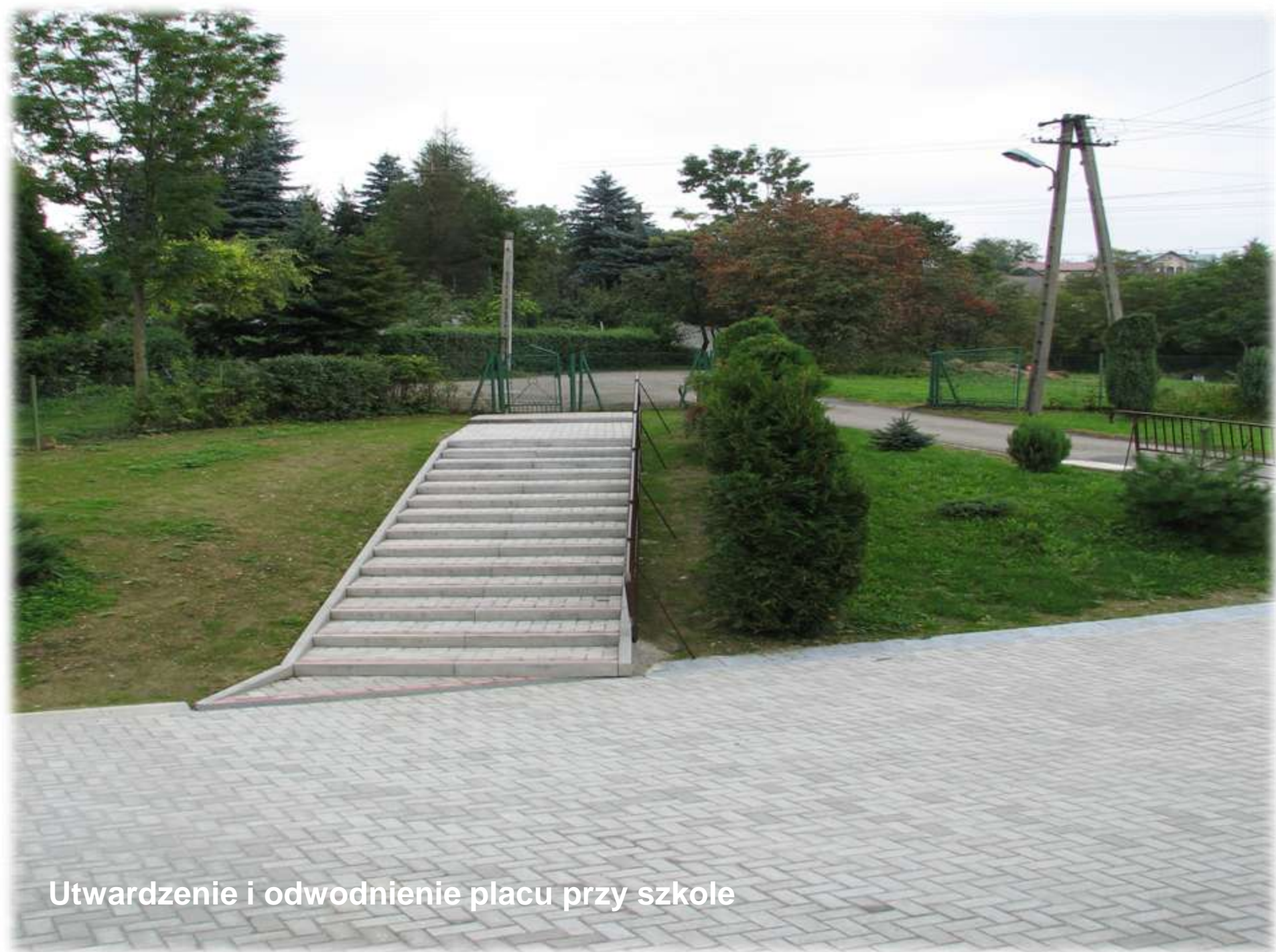
Utwardzenie i odwodnienie placu przy szkole